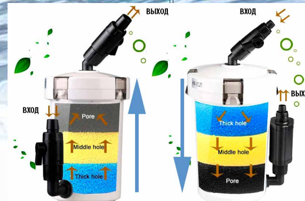
HW-602 / 603

Все наполнители входят в комплект поставки